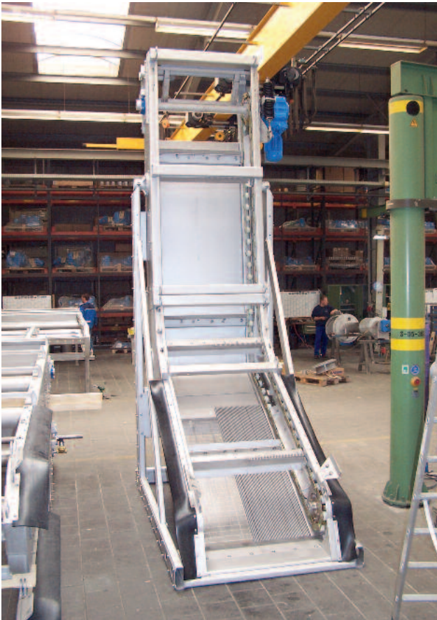
HUBER Rake-Max®-hf vor der Auslieferung im Werk zeigt deutlich den flachen und daher hydraulisch günstigen Siebabschnitt