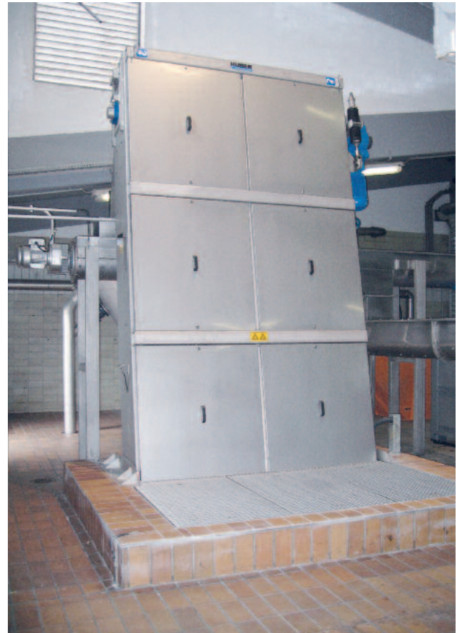
Der HUBER Harken-Umlaufrechen RakeMax®-hf ist von außen nicht von der bewährten Basismaschine RakeMax® zu unterscheiden.