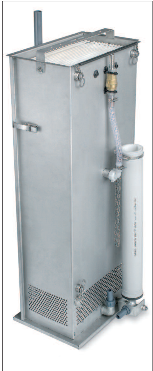
Die komplette, vollbiologische Reinigungseinheit mit Membranfilterplatten und Belüfter garantiert beste Abwasserreinigung, gemäß Ablaufklasse +H.

unterschreitet konstant die international gesetzlich festgelegten Grenz- und Richtwerte (einschließlich EG-Badegewässerrichtlinie).